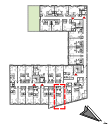
Plan de repérage / niveau 5